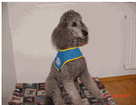
Slika 2: Oprsnica z znakom društva Tačke pomagačke. 11

Tudi psi terapevti so prepoznavni z ličnimi oprsnicami z znakom društva. Obenem to pomeni, da se redno usposabljaajo in da so veterinarsko pregledani, redno, dvakrat letno odpravljeni notranji in zunanji zajedavci in cepljeni proti aktualnim boleznim.