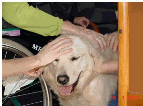
Slika 3: Božanje psa terapevta. 12

Med božanjem živali se človek umiri in preplavijo ga hormoni sreče. Tačke pomagačke obiskujejo predvsem male bolnike, duševno prizadete in ostarele. Vsem pomagajo razvijati gibalne, zaznavne, miselne, čustvene in socialne zmožnosti. Živali obiskanim, posebej otrokom, takoj na obraz narišejo nasmeh in srečo. Morebitni strah pred štirinožci se skoraj vedno razblini že ob prvem srečanju s psom in njegovim lastnikom. Njihovi kužki npr. pogosto ležijo na prsih malega bolnika, ki dobiva kemoterapijo. Tako jo laže prenaša.