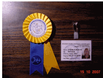
Slika 1: Oznaka društva Tačke pomagačke. 10

Vsak prostovoljec ima tudi izkaznico s sliko, evidenčno številko in datumom veljavnosti. Izkaznica je poglobljen dokument za identifikacijo prostovoljca in jo je pri svojem delu dolžan nositi na vidnem mestu.