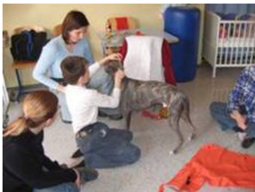
Slika 4: Pes terapevt na obisku. 14